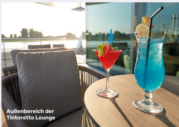
Außenbereich der Tintoretto Lounge