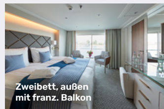
Zweibett, außen mit franz. Balkon